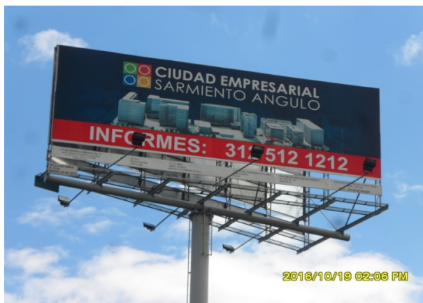
SENTIDO OESTE- ESTE DE LA VALLA TUBULAR