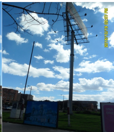
UBICACIÓN VALLA TUBULAR